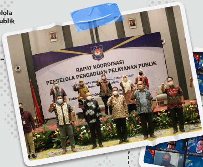
Rapat Koordinasi Pengelola Pengaduan Pelayanan Publik