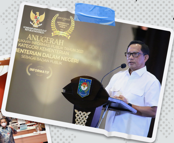
Anugerah Keterbukaan Informasi Publik Tahun 2021