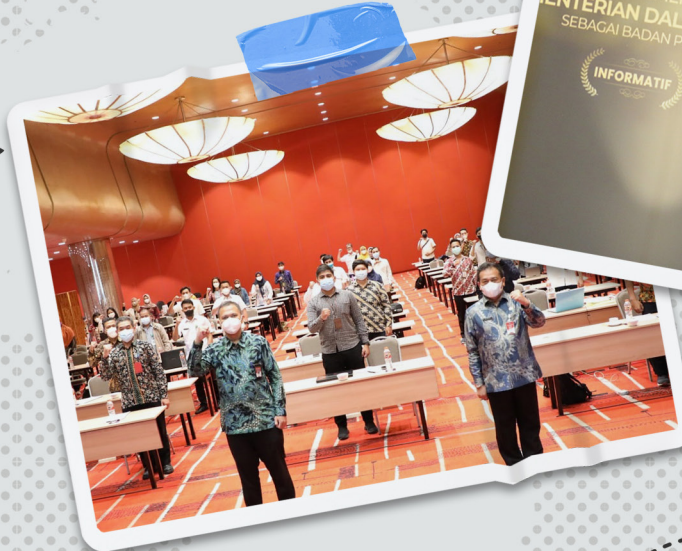
Bimbingan Teknis Pengelolaan Pengaduan dan Informasi Publik di Lingkungan Kementerian Dalam Negeri dan Pemerintah Daerah