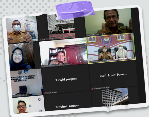
Asistensi Pengisian Kuesioner Monev Keterbukaan Informasi Publik Tahun 2021 Kepada Pemerintah Daerah