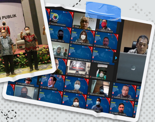
Webinar Keterbukaan Informasi Publik Kemendagri dan Pemerintah Daerah