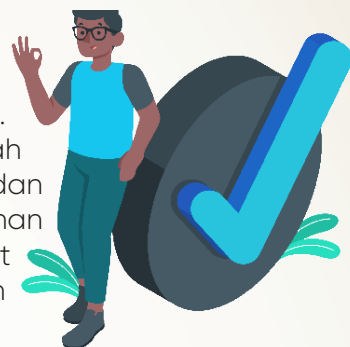
HASIL REKAPITULASI PERMOHONAN INFORMASI YANG DIKABULKAN OLEH KEMENDAGRI SELAMA TAHUN 2021

Selama tahun 2021 tidak ada permohonan informasi yang disampaikan secara langsung kepada Kementerian Dalam Negeri. Seluruh permohonan informasi disampaikan secara tidak langsung melalui media aplikasi ppid.kemendagri.go.id dan email ppid@kemendagri.go.id. Berdasarkan data, jumlah permohonan informasi yang masuk adalah 476 permohonan informasi, dan sebanyak 447 permohonan informasi dikabulkan seluruhnya dan 12 permohonan informasi ditolak. Dari total seluruh permohonan informasi dimaksud terdapat 17 permohonan informasi yang menjadi keberatan informasi. Namun seluruh